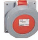
555488 PANEL SOCKET