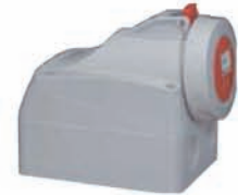
555458 SURFACE MOUNTING SOCKET