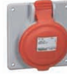
555188 PANEL SOCKET