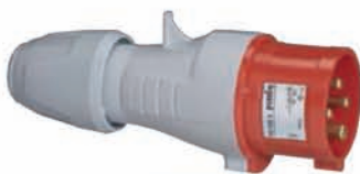
555438 STRAIGHT PLUG