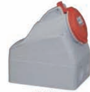
555258 SURFACE MOUNTING SOCKET