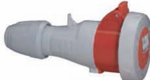
555418 MOBILE SOCKET