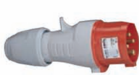
555128 STRAIGHT PLUG